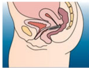
2.避孕環是平貼在陰道底部，深度在子宮頸口前