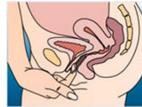
3.雙手洗淨後以食指勾住避孕環，慢慢拉出來即可

* 材質： 透明環狀EVA材質(生理相容性極高，且不會被人體所吸附或排斥的醫療級矽膠材質(3))。